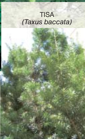
TISA ( Taxus baccata )