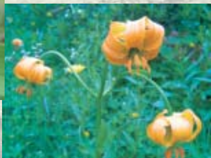
ZLATO JABOLKO ( Lilium carnolicum )