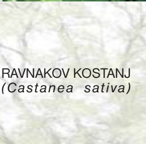
RAVNAKOV KOSTANJ ( Castanea sativa )