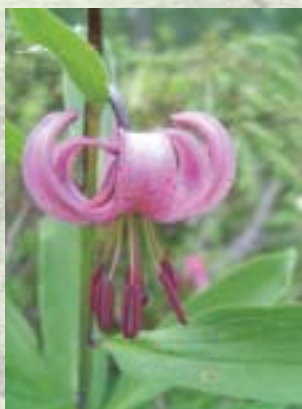
ZLATI KLOBUK ( Lilium martagon )