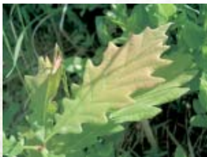
REBRNIKOV HRAST ( Quercus petraea )

Avtorji projekta: Petra Gregorc, Peter Medved, Katja Poglajen, Petra Ravš in Nika Razpotnik Izdajatelj: Občina Vojnik Oblikovanje in priprava za tisk: Dinocolor Naklada: 5000 izvodov