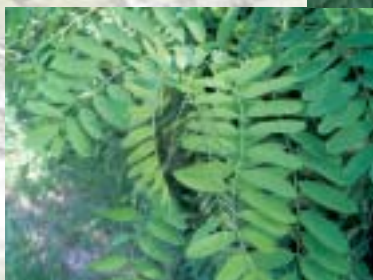
NAVADNA ROBINJA ( Robinia pseudoacacia )