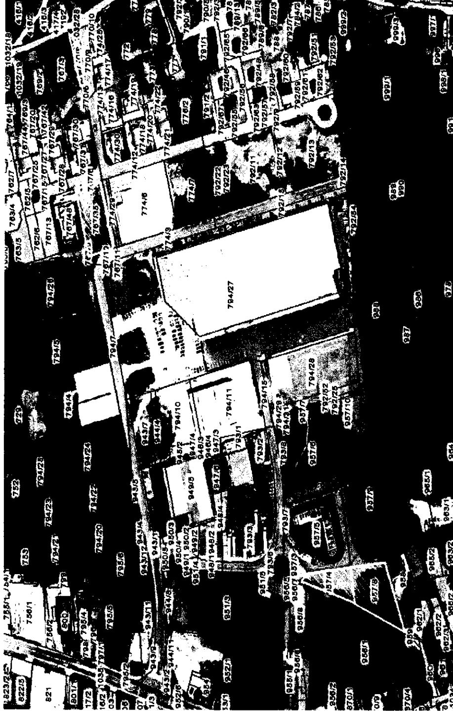
Priloga 2: Prikaz prostih parcel