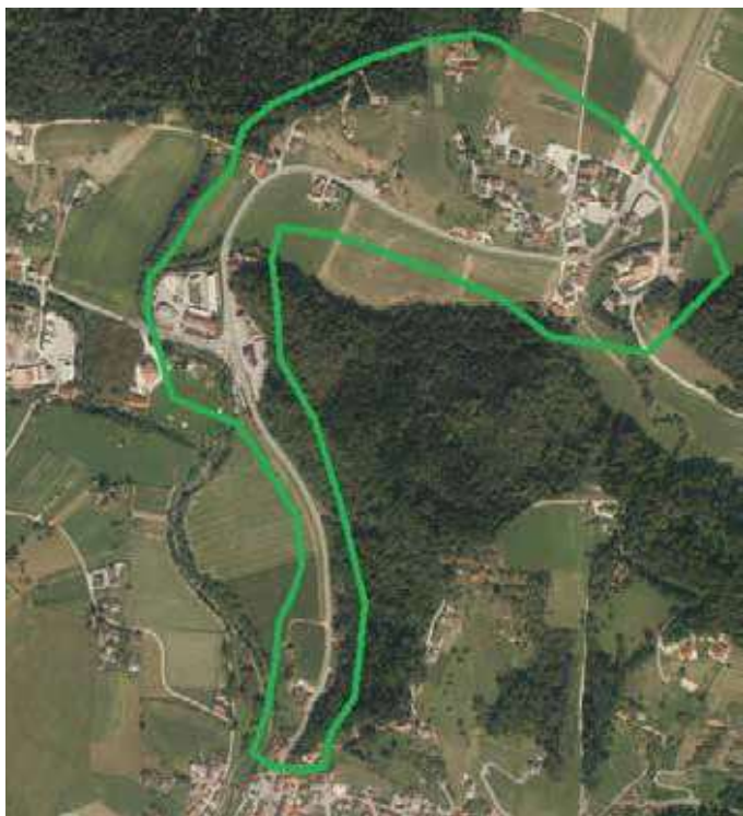
Območje načrtovane kanalizacije Ivenca

Največji projekt na področju kanalizacije izven