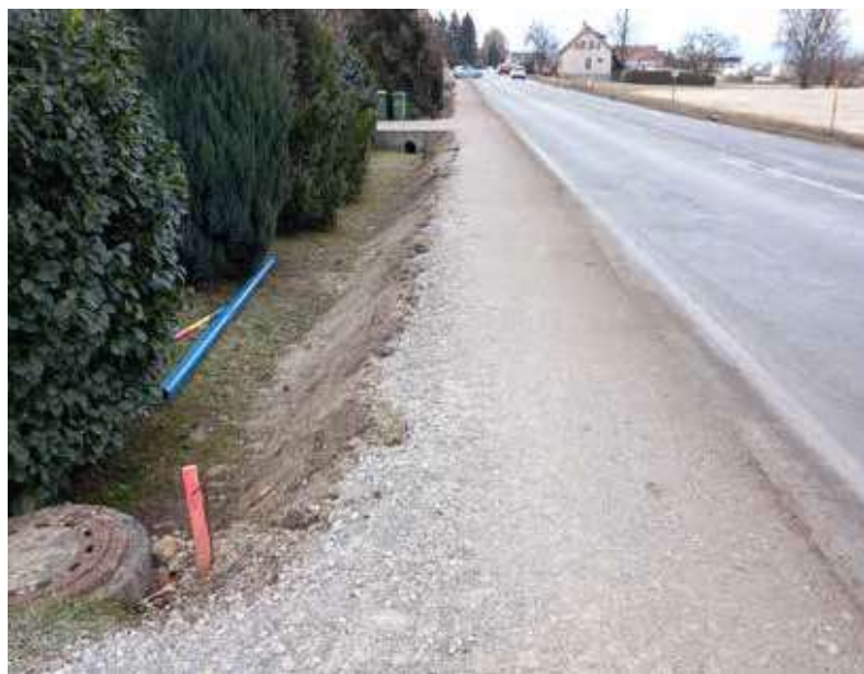
Obnova magistralnega vodovoda ob Celjski cesti

V Vojniku je trenutno v teku tudi obnova magistralnega vodovoda od parkirišča nasproti pokopališča ob Celjski cesti do križišča za vstop v obrtno cono pri Avtohiši Čepin. Projekt je financiran iz namenskih sredstev amortizacije in ga vodi VOKA Celje v sodelovanju z Občino Vojnik, izvaja pa podjetje Brahigradnje, d. o. o. V okviru projekta je že izvedena menjava glavne cevi