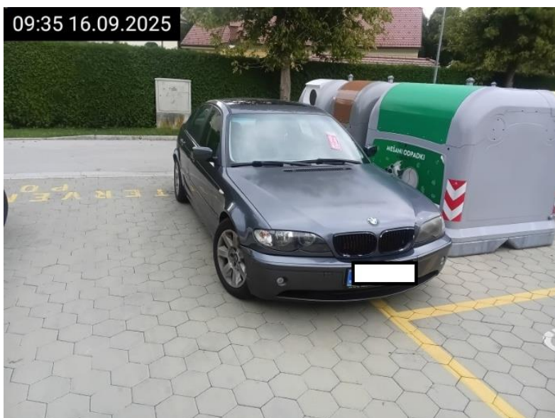
Parkiranje na intervencijski poti.