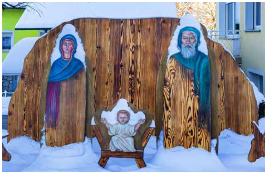
Snežna oddeja na jaslícáh družíne Marčič