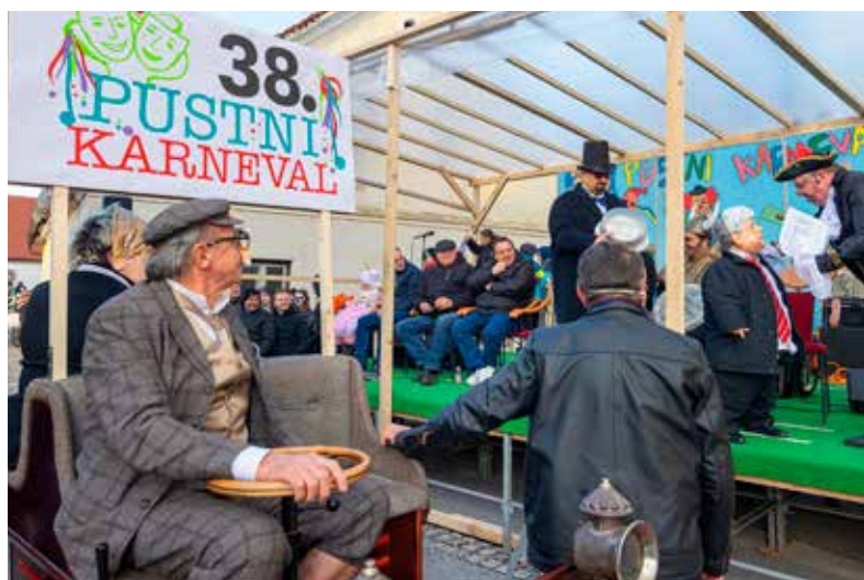
Torta za Kučana