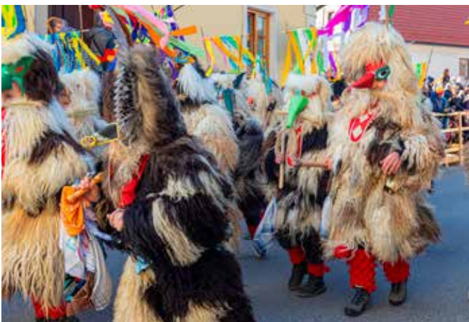
Tretješolci POŠ Nova Cerkev, KURENTI