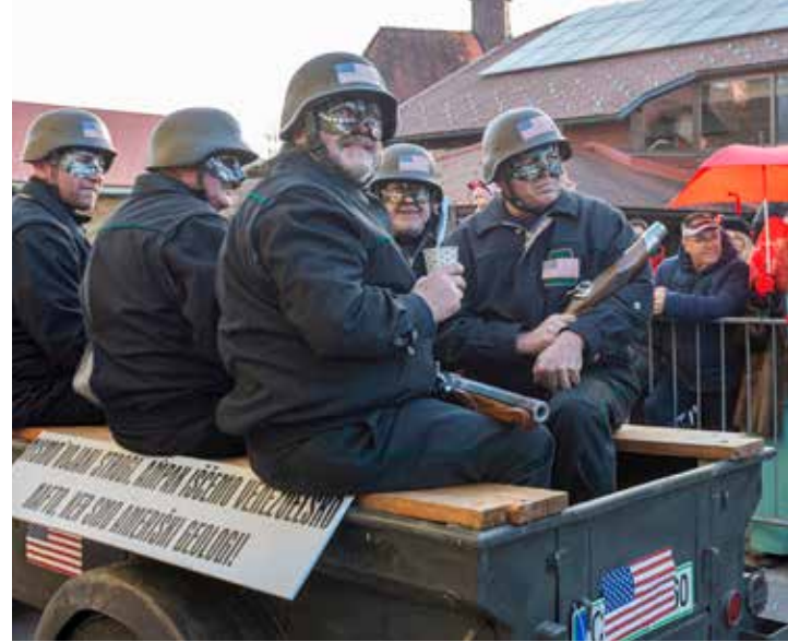
Možnaristi Lanšperg - Nova Cerkev