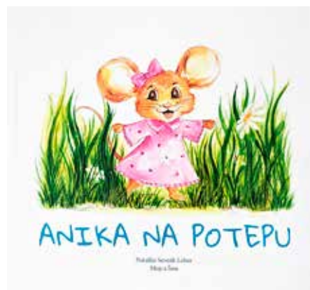
Radoživa junakinja, miška Anika, je prispodoba nagajive in lahkomišelnice deklince.

Glavno sporočilo je prav gotovo, da je svet lep, če po pameti stopamo vanj. Za to seveda potrebujemo modre in jasne misli, otroci in mladostniki pa večkrat niso prav preudarni, niti premišljeni. Radi delajo, kar jim je »fajn«, in ne vedno, kar je prav, zato še eno sporočilo: vse je lažje v objemu tople družine, ki te v vsem podpira oziroma ti stoji ob strani, tudi če ne gre vse po načrtih. Nobena napaka ni usodna, vse je popravljivo in ne nazadnje tudi sprejemljivo – novo sporočilo: ljubezen lahko gore premika.