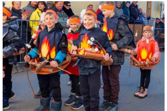
PLAMENČKI, 2. razred POŠ Nova Cerkev