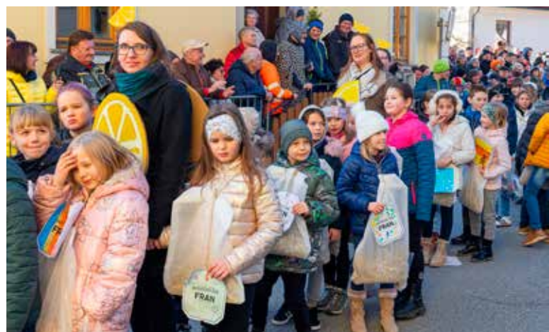
ČAJ IN LIMONICE, OŠ Anton Bezenšek Frankolovo