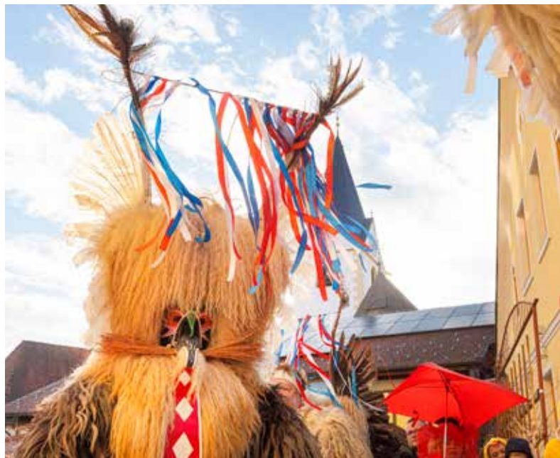
Kurenti iz Velenja