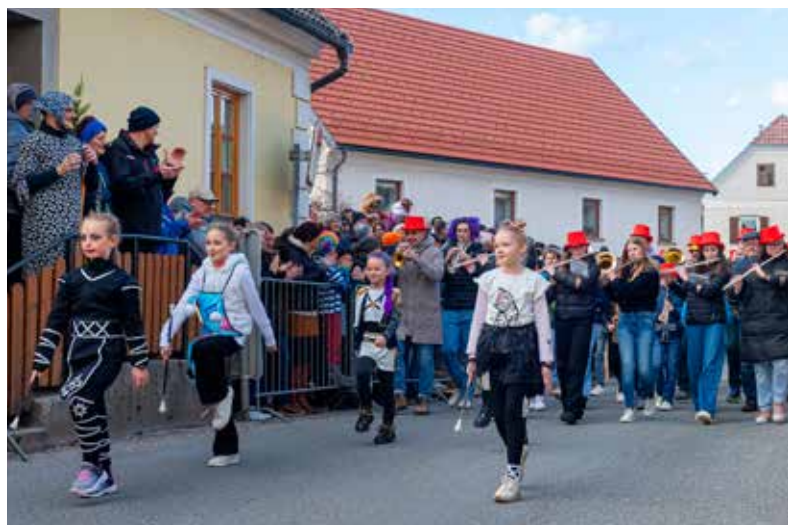
Mažoretke iz Radeč