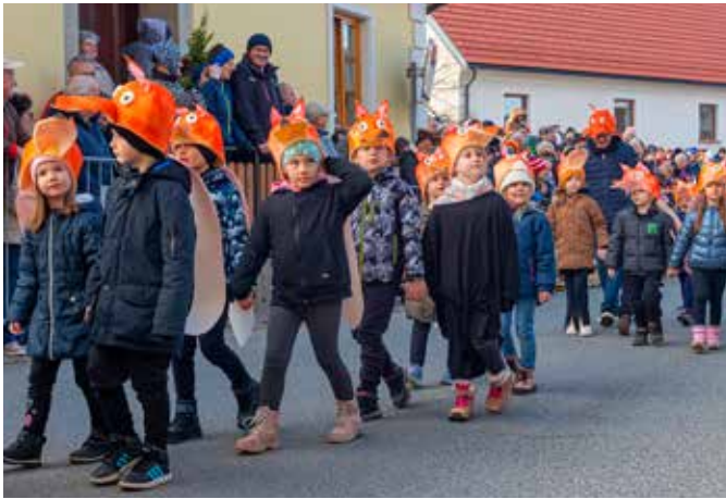
LISICE, Vrtec Mavrica Vojnik, igralnica 11