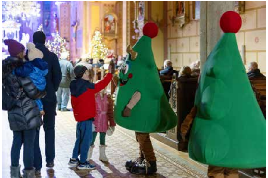
Hojka in Hojko