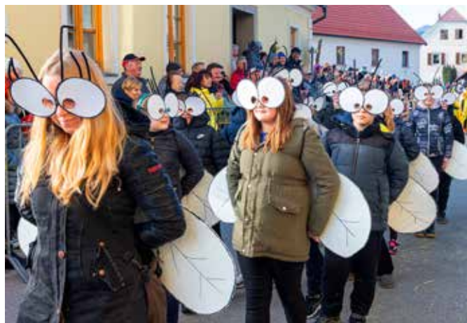
MUHE, 4. b OŠ Vojnik