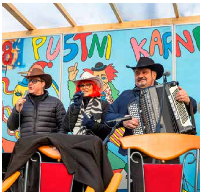
Karnevalski Ansambel Soški Kajuhi je poskrbel za dobro vzdušje.