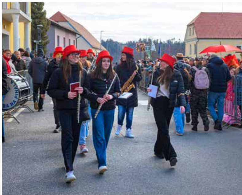
Mladinski orkester Godba na pihala Nova Cerkev