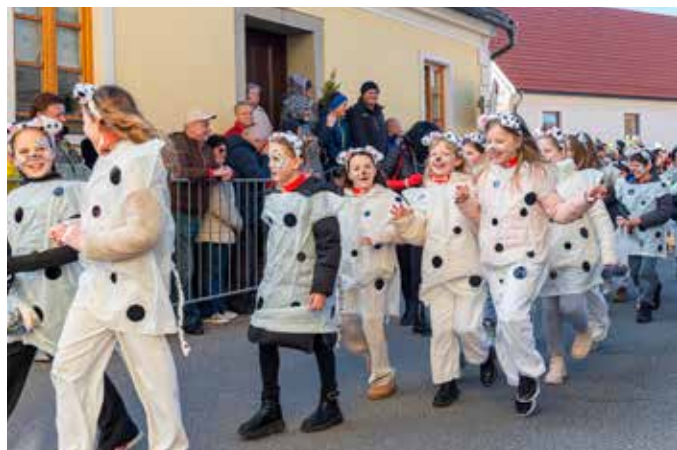
101 DALMATINEC, 4. a OŠ Vojnik