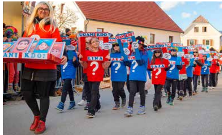
UGANI, KDO, 4. razred POŠ Nova Cerkev