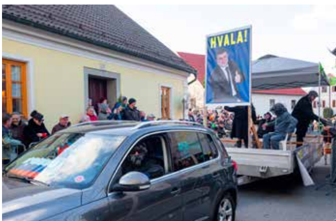
Kandidat za državni zbor