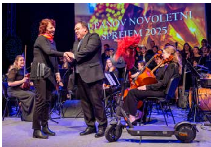
Podelitev nagrade izžrebani uporabnici aplikacije Občine Vojnik.

Županov sprejem je še enkrat potrdil, da Občina Vojnik ponosno spremlja svoje ustvarjalne, športu predane in uspešne mlade ter manj mlade športnike.