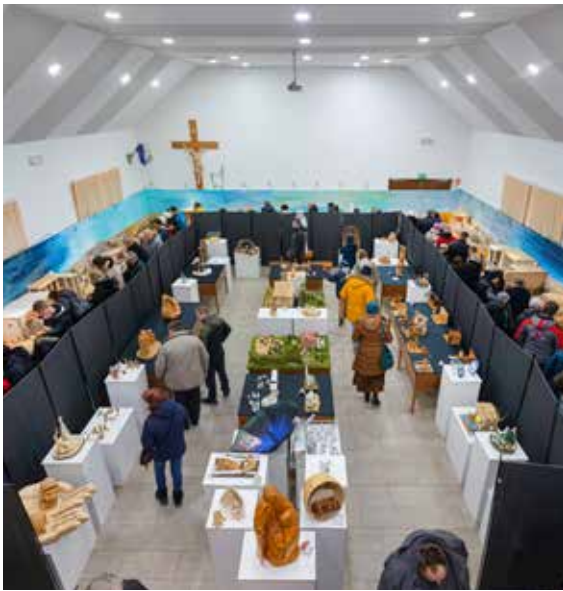
Razstava jaslric v Domu sv. Jerneja.