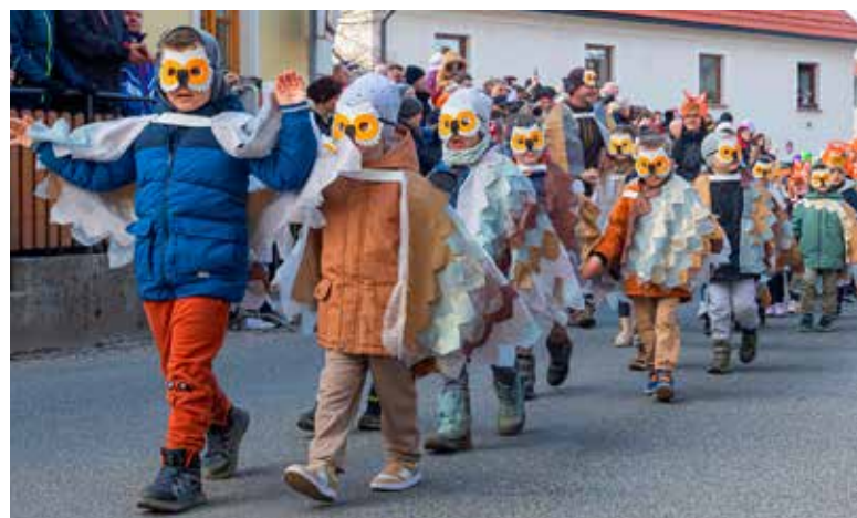
SOVE, Vrtec Mavrica Vojnik, igralnica 10