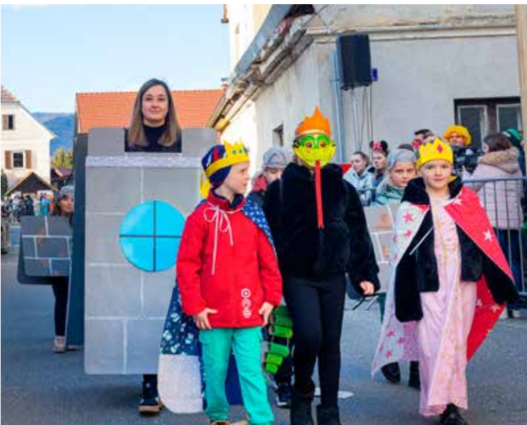
GRAJSKA DRUŠČINA, OŠ Dobrna