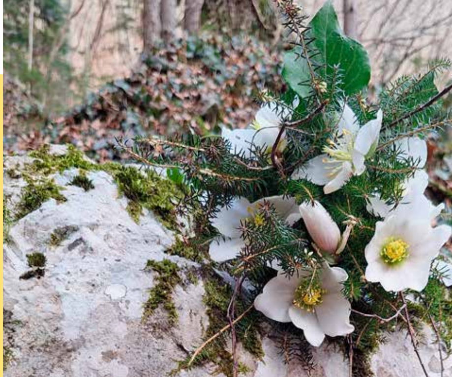
S poti v Lindek