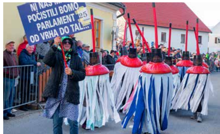
Čiščenje parlamenta, Društvo Dobra volja iz Pristove