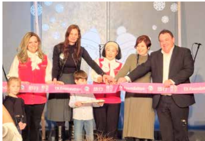
Iz slavnostnega odprtja obnovljene šole

praznovala ta pomembni korak za lokalno skupnost. Skupaj gradimo boljšo prihodnost za naše otroke.