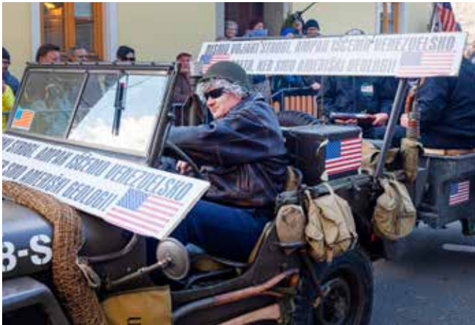
Ameriška vojska v Venezueli