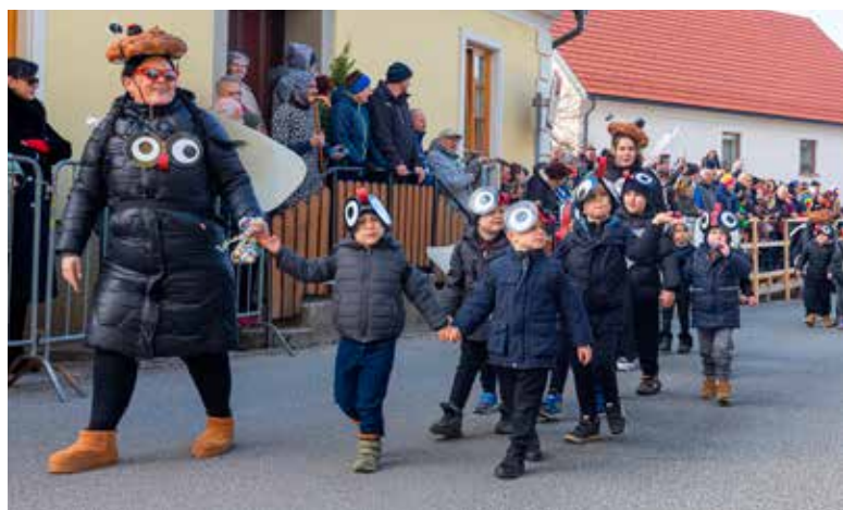
MUHE, Vrtec Mavrica Vojnik, igralnica 8

Razigrane ŽABE, Vrtec Mavrica Vojnik, igralnica 9