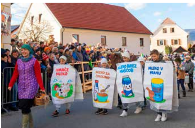
Petošolci POŠ Nova Cerkev in MLEKO