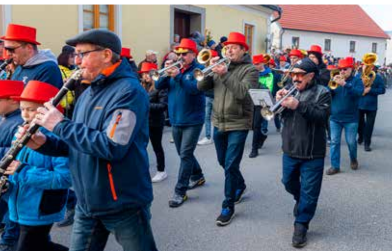
Godba na pihala Nova Cerkev, Dobrna in Vitanje