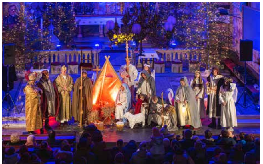
Žive jaslícé v cerkvi sv. Jerneja, Vojnik