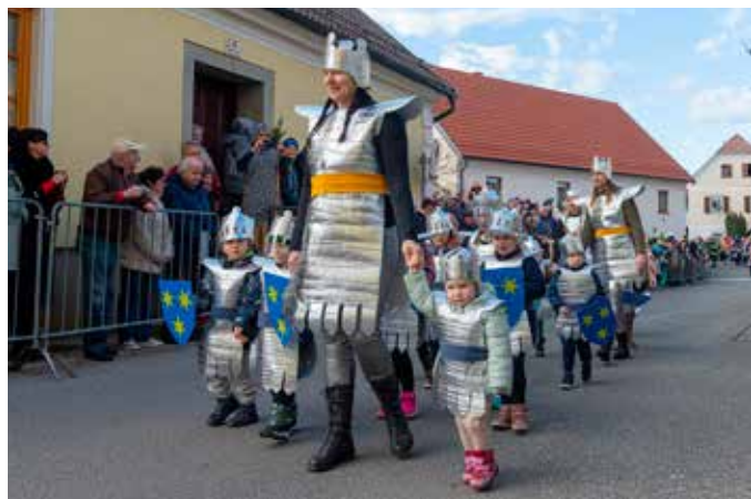
VITEZI, Vrtec Mavrica Vojnik, enota Nova Cerkev