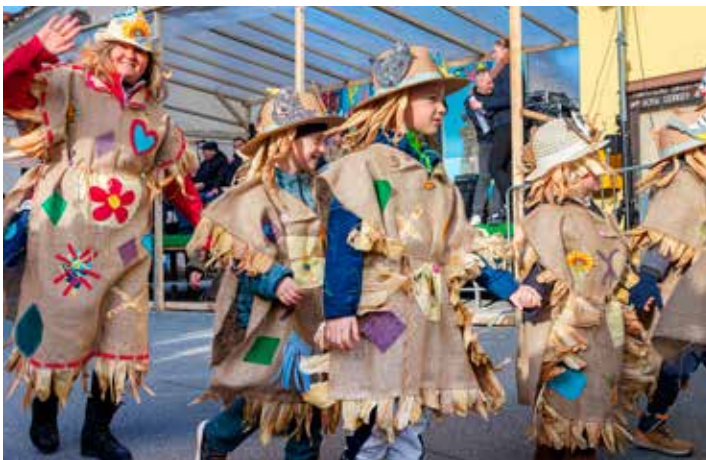
Prvošolci POŠ Nova Cerkev kot PTIČJA STRAŠILA