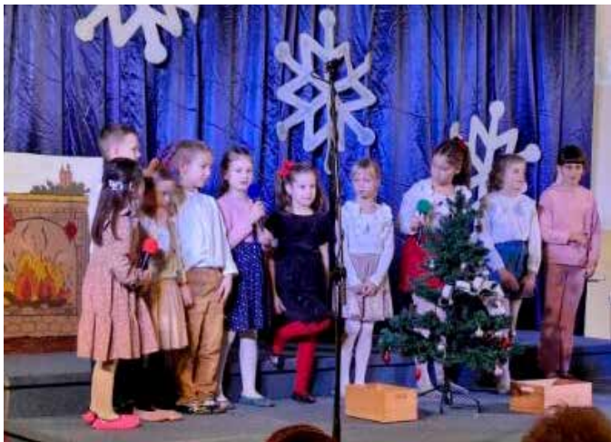
Nastop učencev na novoletni prireditvi

Za prijeten zaključek dogodka so poskrbeli starši in učenci, ki so spekli domače pecivo ter z njim pogostili vse obiskovalce. Dogodek je tako minil v toplem, prazničnem in povezovalnem vzdušju.