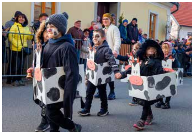
Igrive KRAVICE, Vrtec Mavrica Vojnik, enota Frankolovo