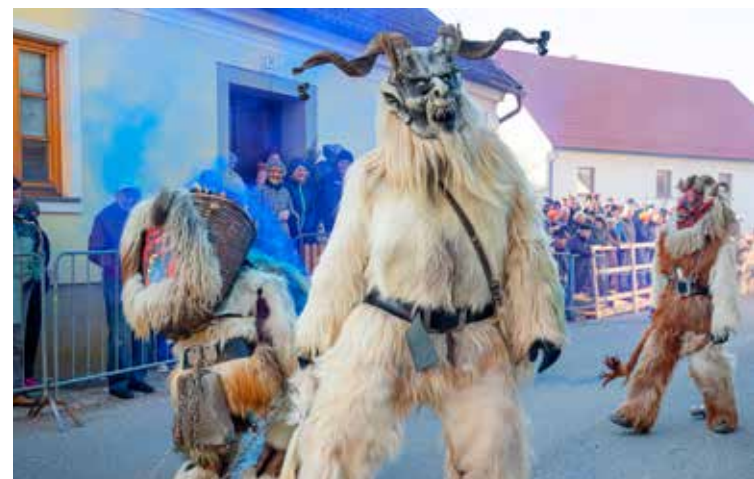
Krampusi iz Žetal