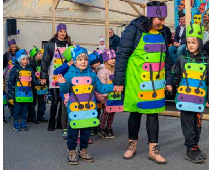
SOPRANSKI ZVONČKI, Vrtec Danijelov levček Vojnik