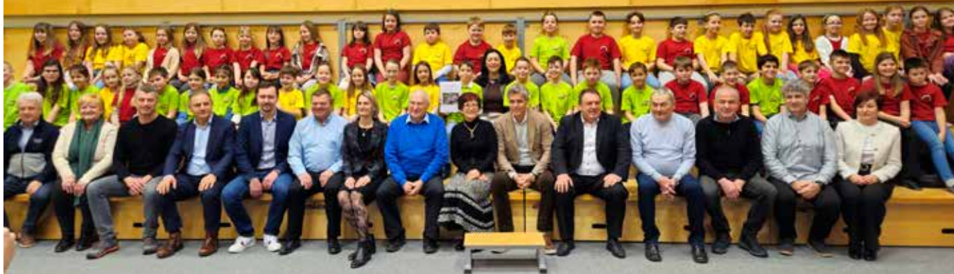
Slovesnost podpisa gradbene pogodbe je potekala v prisotnosti številnih gostov in partnerjev projekta.