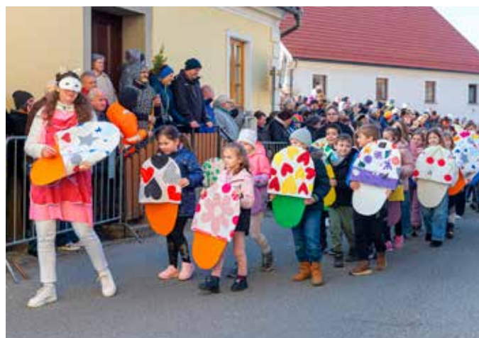
COPATKI, POŠ Šmartno v Rožni dolini