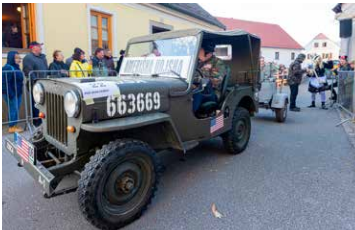
Viki Krajnc in ameriška vojska