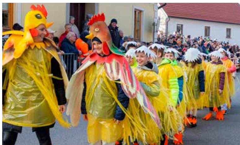
VESELA PIŠČANČJA DRUŽINA, 4. c OŠ Vojnik