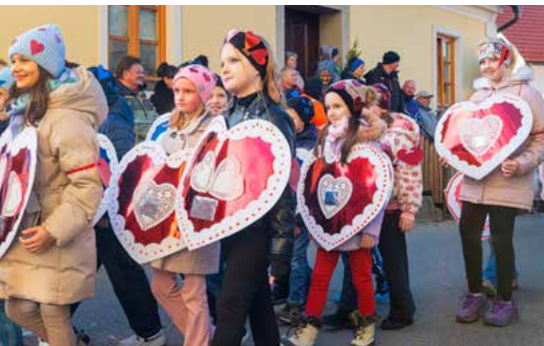
VALENTINČKI, 3. a in 3. b-razred OŠ Vojnik