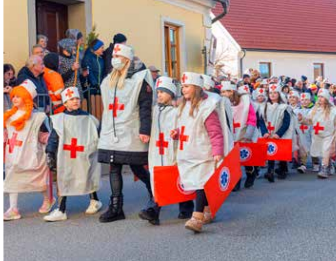
ZDRAVNIKI, 2. a in 2. b-razred OŠ Vojnik