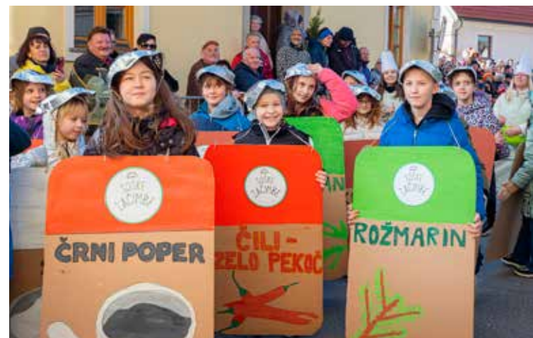
ZAČIMBE iz POŠ Socka