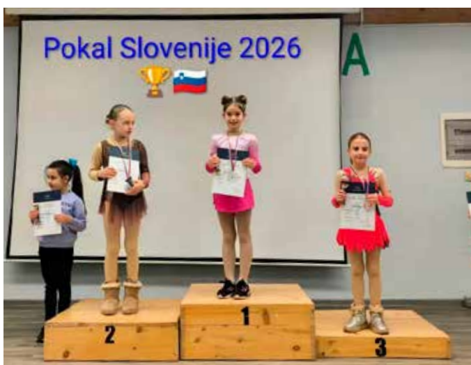
Osemletna Zarja je osvojila zmago na tekmovanju Pokal Slovenije na Bledu.

Na ledu vsak dan, pogosto že pred poukom