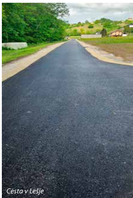
Cesta v Lešje

poti Rove-Brdce v dolžini 260 metrov in širine tri metre ter javno pot Socka-Velika Raven v dolžini 140 metrov in širine tri metre.