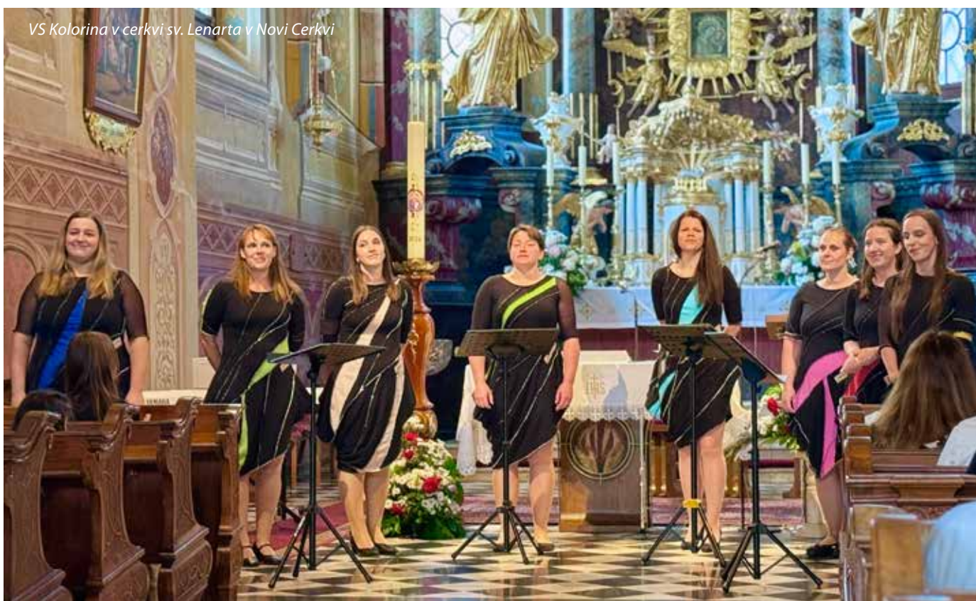
VS Kolorina v cerkvi sv. Lenarta v Novi Cerkvi

KUD France Prešeren Vojnik tako ostaja prostor ustvarjalnosti, druženja in ohranjanja kulturne tradicije, hkrati pa z veseljem ustvarja nove zgodbe.