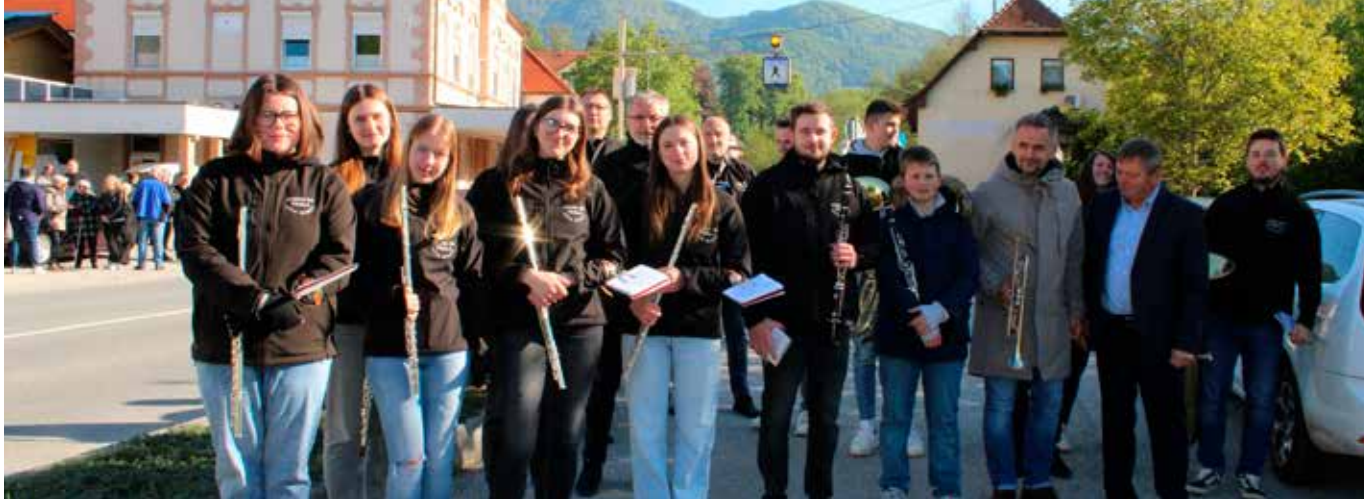
Prvomajska budnica Godbe na pihala Nova Cerkev na Frankolovem