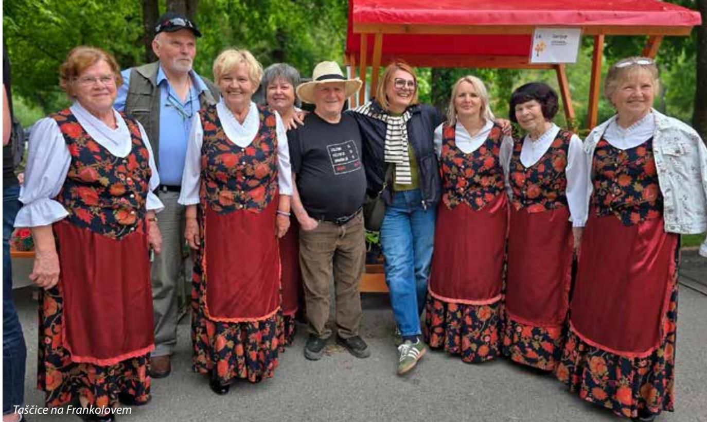
Taščice na Frankolovem

Poseben trenutek letošnje pomladi je bilo praznovanje 90-letnice Moškega pevskega zbora KUD France Prešeren Vojnik, ki že devet desetletij s pesmijo bogati naš kraj. Jubilej je bil lepa priložnost za druženje, obujanje spominov in zahvalo vsem, ki so v vseh teh letih soustvarjali zgodbo zbora.