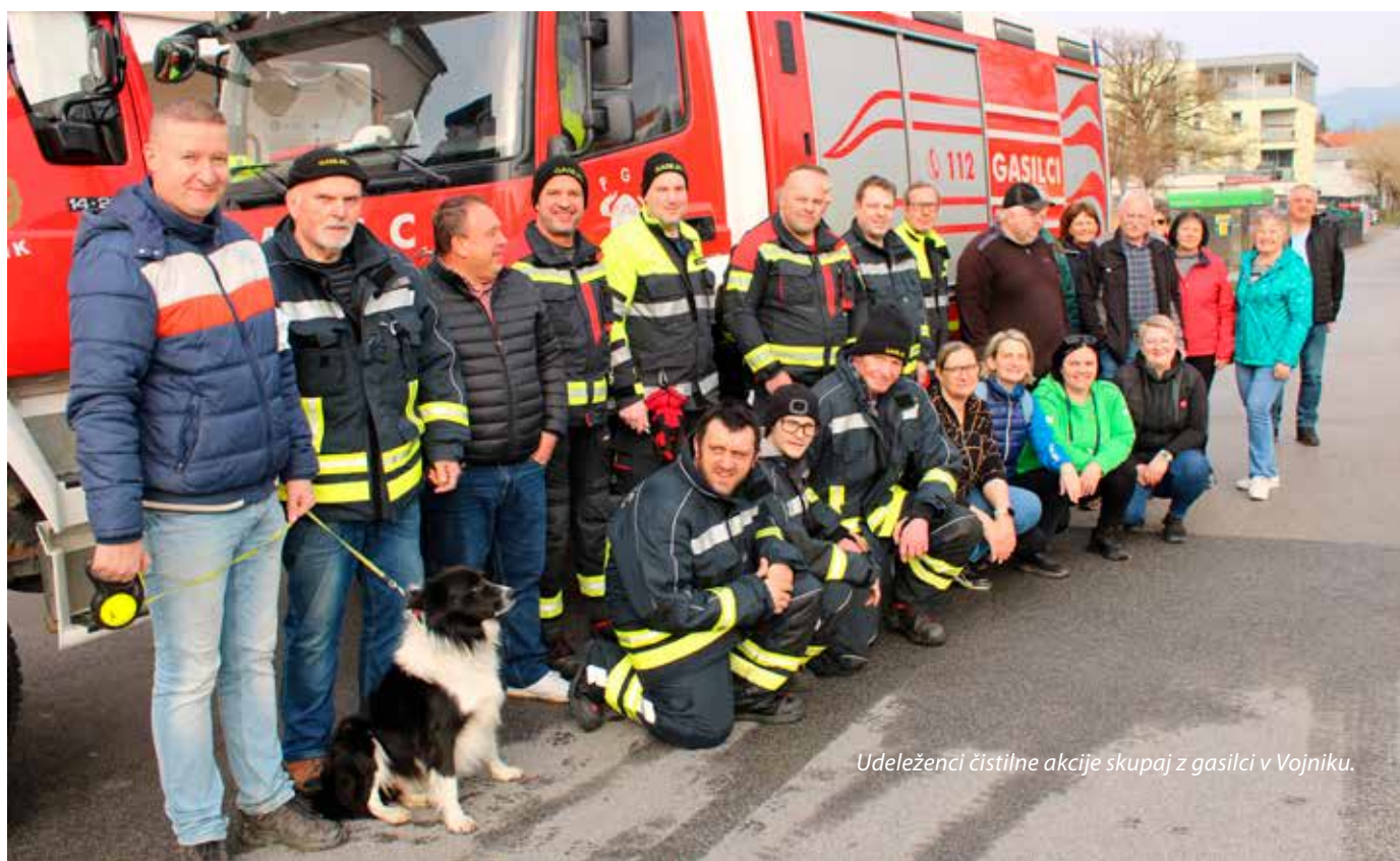
Udeleženci čistilne akcije skupaj z gasilci v Vojniku.

Iskrena hvala vsakemu posamezniku, društvu in organizaciji za vaš čas, trud, energijo in neustavljivo dobro voljo. Skupaj smo poskrbeli, da je naša občina čista in ponosno pripravljena na cvetoče pomladne dni.