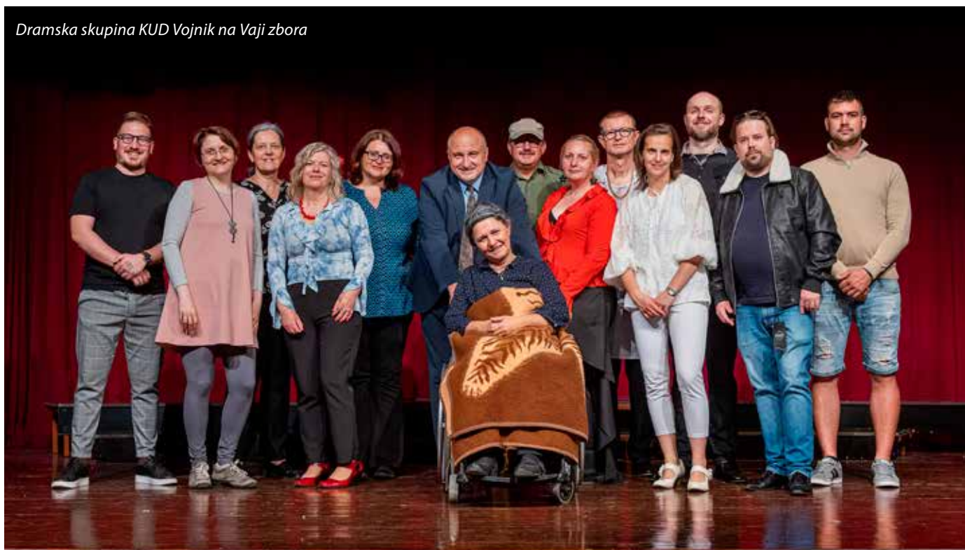
Dramska skupina KUD Vojnik na Vaji zbor

Pomlad je bila v Kulturno-umetniškem društvu (KUD) France Prešeren Vojnik zelo pestra in ustvarjalna. Pretekli meseci so