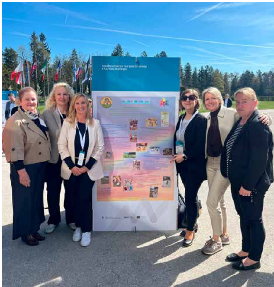
Kakovost in samoevalvacija v Vrtcu Mavrica Vojnik, Brdo pri Kranju, Članice razvojnega tima

Učitelje in vse zaposlene na šoli smo poskušali vključiti in jih spodbuditi