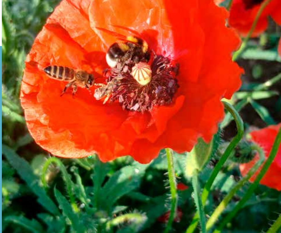
Dan čebele, 20. maj