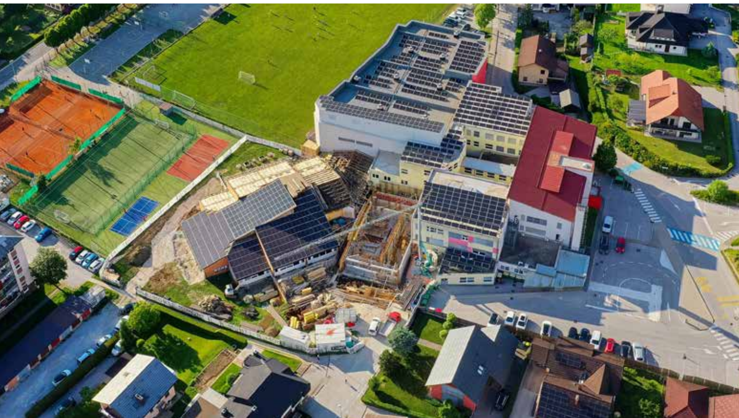
Gradbišče je ustrezno zavarovano in organizirano skladno z veljavnimi predpisi ter vsemi predpisanimi varnostnimi ukrepi.

Posebna pozornost je v času izvajanja investicije namenjena varnosti učencev, zaposlenih in vseh uporabnikov šole. Učenci so bili pravočasno preseljeni iz starega dela objekta, predvidenega za rušenje, s čimer je zagotovljena varna izvedba gradbenih del brez vpliva na izvajanje pouka in gibanje otrok v neposredni bližini gradbišča. Gradbišče je ustrezno zavarovano in organizirano skladno z veljavnimi predpisi ter vsemi predpisanimi varnostnimi ukrepi, pri čemer se dela izvajajo pod stalnim nadzorom odgovornih strokovnih služb in koordinatorja varstva pri delu. V nadaljevanju projekta je do konca maja 2026 predvidena