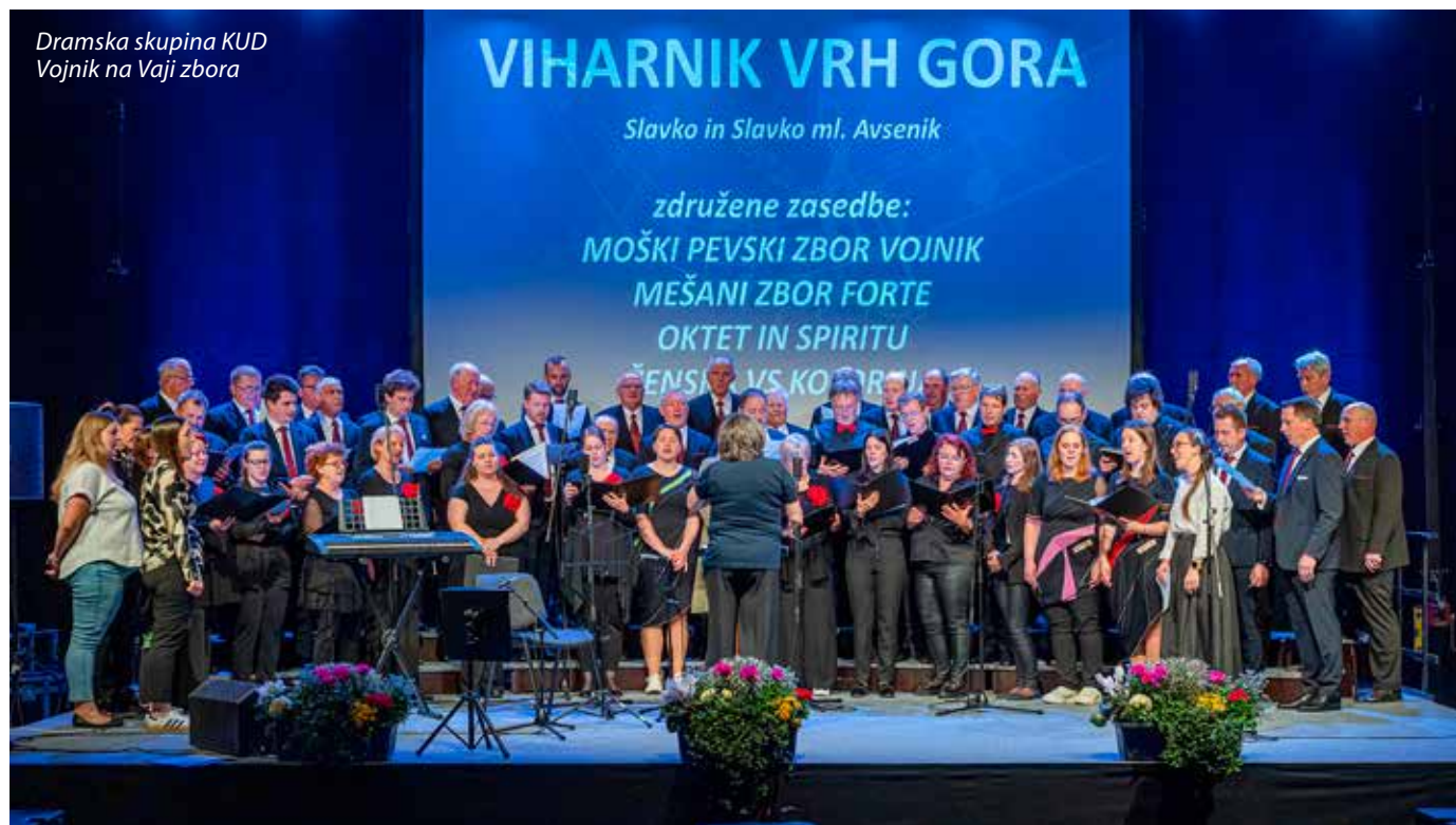
Dramska skupina KUD Vojnik na Vaji zbor

naši občini ter povezuje ljudi skozi umetnost in skupna doživetja.