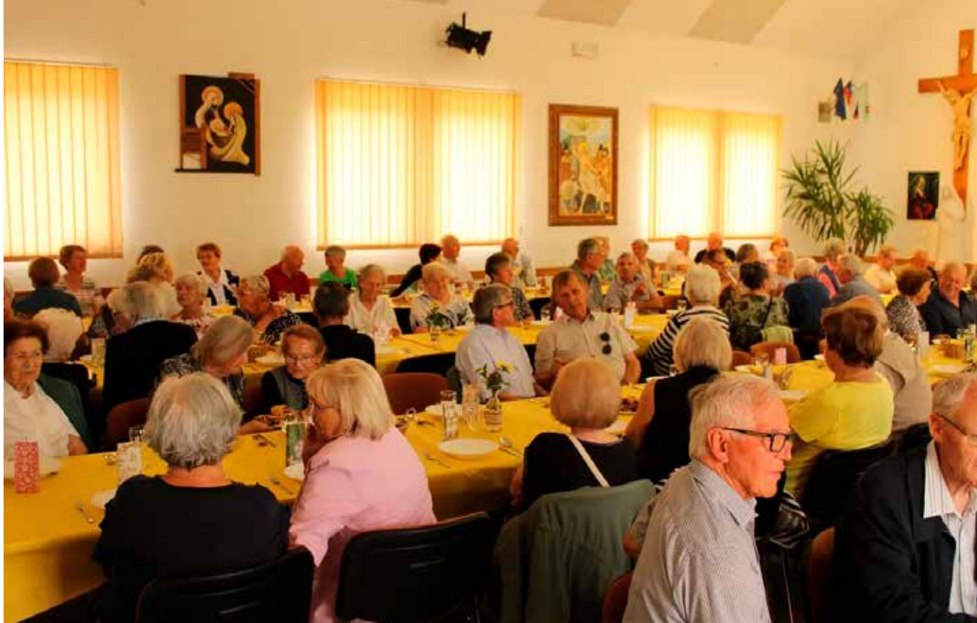
Srečanje starejših krajanov je minilo v pristrčnem vzdušju.