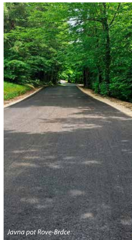
Javna pot Rove-Brdce