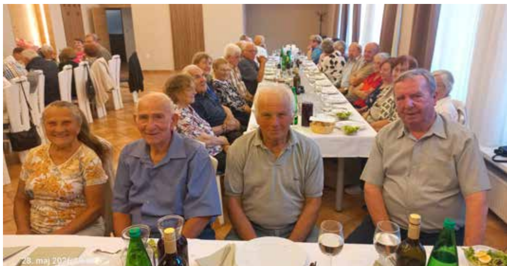
Srečanje starejših krajanov in krajanek